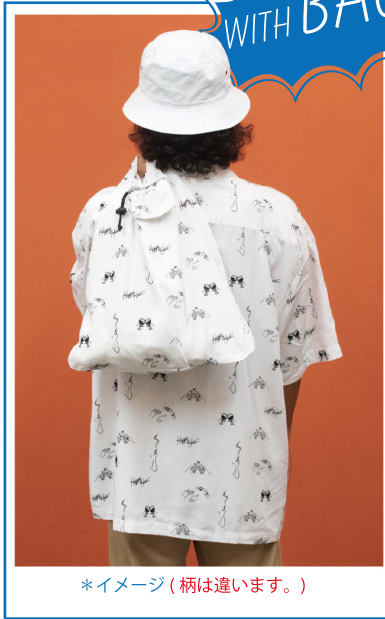
*イメージ(柄は違います。)