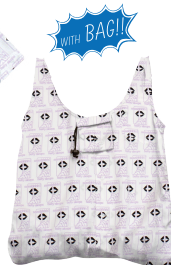
*共地の BAG が付きます。