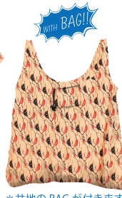
*共地の BAG が付きます。