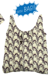
*共地の BAG が付きます。